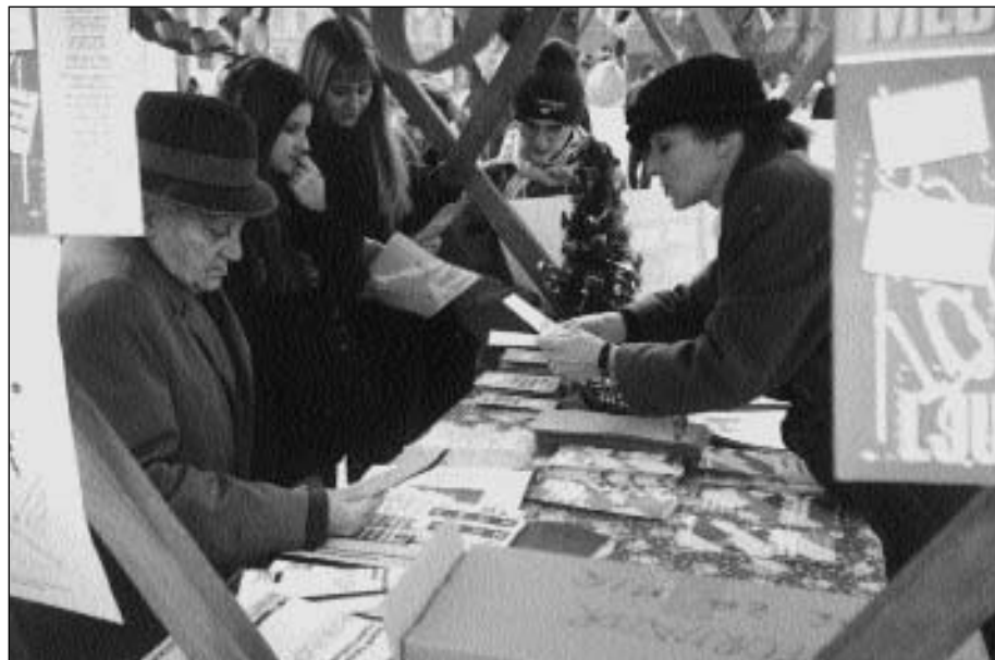
Obilježavanje Dana ljudskih prava 10. prosinca na trgu A. Starčevića u Osijeku.

U povodu obilježavanja 50. obljetnice Opće deklaracije o pravima čovjeka i akcije ženskog aktivizma održana je radionica o pravima žena. Tema radionice odnosila se na brak i odnose u braku te reproduktivna prava, a u povodu donošenja novog Obiteljskog zakona.