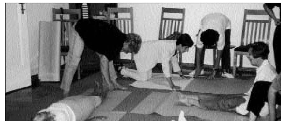
Relaksacija u okviru redovne edukacije za nastavnike.

Hrvati nastavnici-povratnici veoma se teško uključuju u aktivnosti izgradnje povjerenja i mira, jer je konfrontacija interesa snažna. Težak materijalni položaj hrvatskih građana uvjetuje povećanu nervozu i produbljivanje jaza i netrpeljivosti. Slično je i s roditeljima učenika, što se prenosi na djecu i mladež. Odnosi među učenicima su unekoliko povoljniji, ali je vrlo jasna tendencija segregacije te tenzije s povremenim ispadima nasilja. Posebno napete situacije su u nekim mjestima Baranje i u Vukovaru, ali postoje i pozitivni primjeri. Npr., atmosfera je u Kneževim Vinogradima, Bilju i Belom Manastiru ugodnija i povoljnija za rad, jer su ravnatelji škola fleksibilni i osobe koje pomažu rješavanju problema, dok u kolektivima gdje je više nastavnika (Srba) ostalo bez posla vlada suzdržanost.